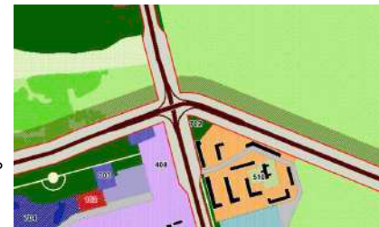
Кольцо на Военинституте (Чем оно не понравилось проектировщикам?)