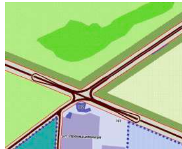
Кольцо на Омск (Чем оно не понравилось проектировщикам?)