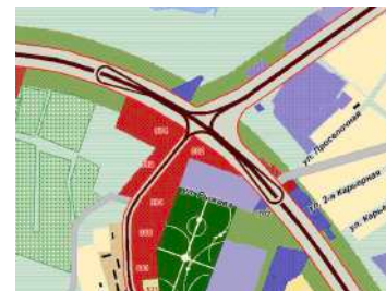
Кольцо на Мамлютку (Чем оно не понравилось проектировщикам?)