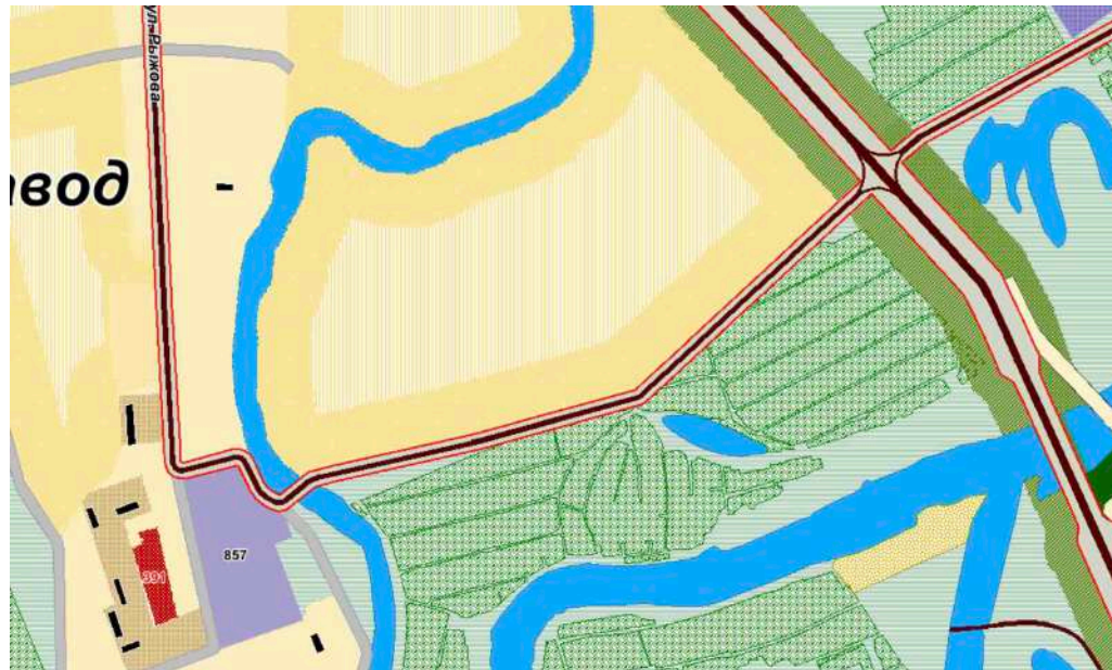
Увеличение улицы Рыжкова напрямую до Мамлютского шоссе

Таким же взглядом смотрим на удлинение улицы Рыжкова в Хромзаводе. Зачем строить дорогу по болотам если существующий трафик очень мал? Ради несколько выигранных минут объезда?